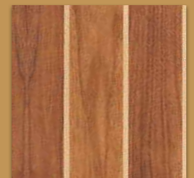
Teak mit heller Fuge