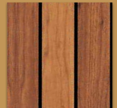
Teak mit schwarzer Fuge