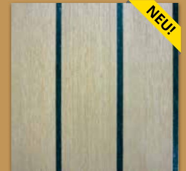
Teak Nachahmung mit schwarzer Fuge